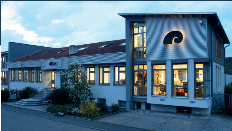
Stammhaus Bad Mergentheim

UFT Umwelt- und Fluid-Technik Dr. H. Brombach GmbH wurde im Jahr 1977 gegründet und ist ein erfolgreiches Unternehmen der Umweltbranche mit etwa 70 Mitarbeitenden, die überwiegend technisch ausgebildet sind. Ein Viertel sind Ingenieure der Fachrichtungen Bauingenieurwesen, Maschinenbau und Elektrotechnik. Arbeitsfeld ist die maschinelle und elektrotechnische Ausrüstung von Anlagen der Regenwasserbehandlung zum Schutz der Fließgewässer und des Grundwassers sowie der Hochwasserschutz.